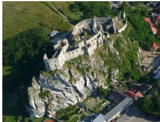
Hrad Beckov, foto: Peter Ondrejovič

prostredníctvom presadzovania vlastných kandidátov v jednotlivých grémiách cirkvi a ekonomického ovládnutia finančných tokov v ústredí cirkvi a kontroly finančných zdrojov zo štátu. Nejde tu len o prostriedky štátu určené na platy farárov a kaplánov. Nie malé zdroje od štátu prichádzajú priamo na ústredie cirkvi a po navrhovanej reštrukturalizácii, by malo ústredie kontrolu nad všetkými prostriedkami. Súčasná informácia o použití prostriedkov štátneho rozpočtu sú však nedostatočné. Transparentnosť je preto nevyhnutná!