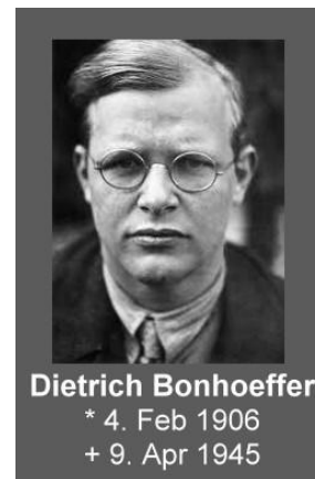
Dietrich Bonhoeffer * 4. Feb 1906 + 9. Apr 1945