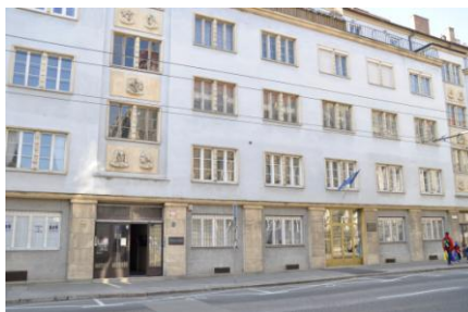
GBÚ – foto prevzaté z internetu