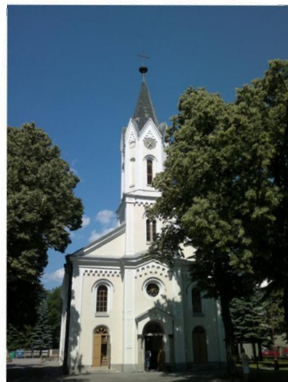
Evanjelický kostol v Martine